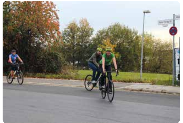
Gemeinsames Radeln zeigt das Gewerbegebiet aus anderer Perspektive.