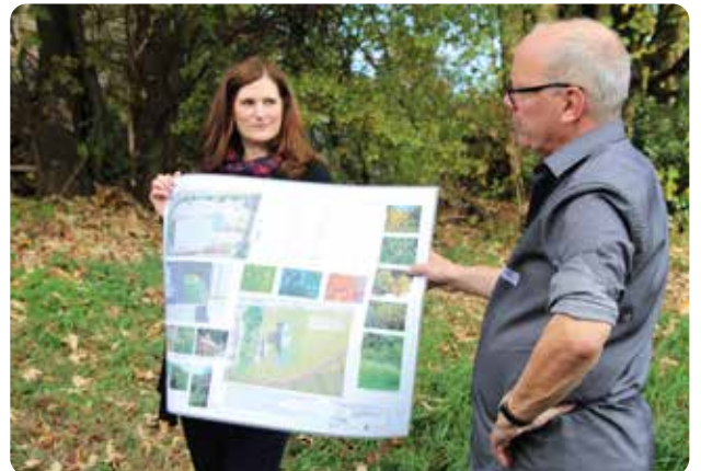
Plan des Unternehmensnetzwerks für einen Treffpunkt im Grünen in Großhülsberg.